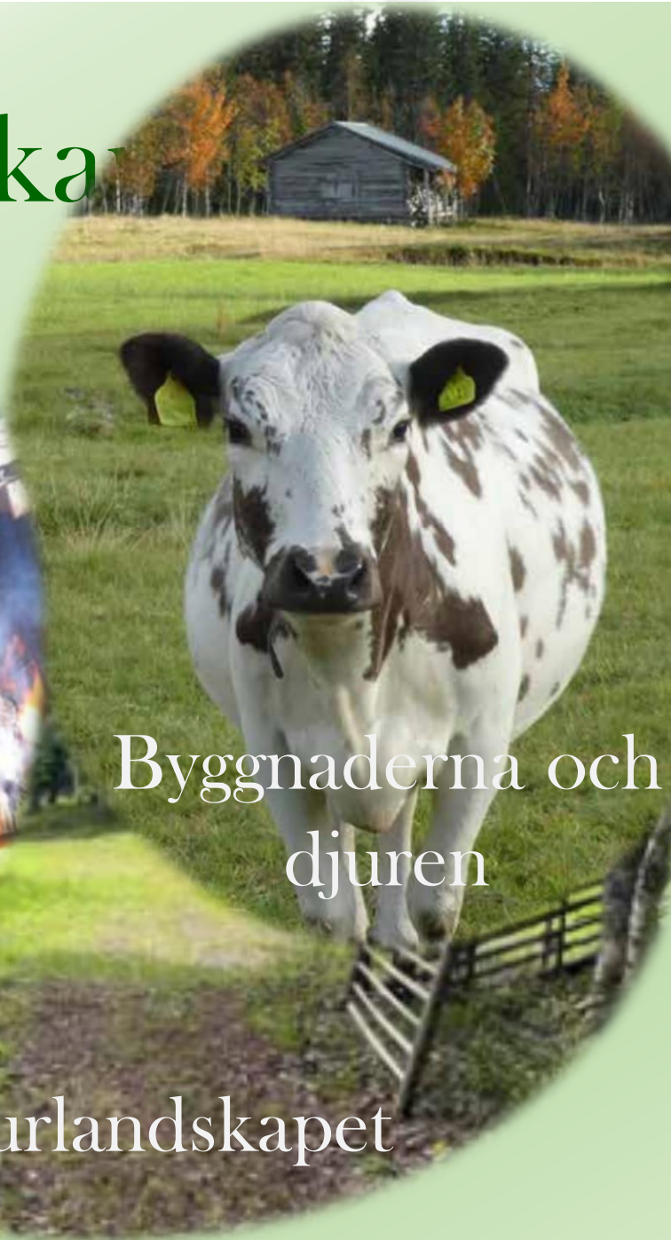
Byggnaderna och djuren