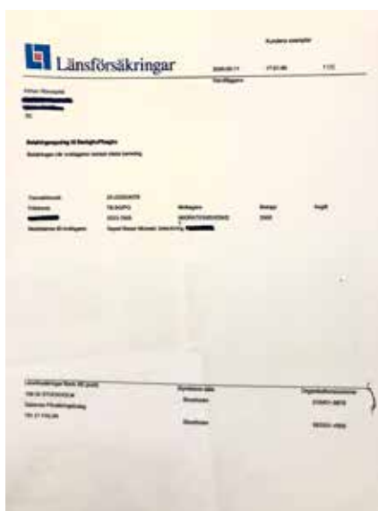
Betalning från Baqer till Migrationsverket avseende ansökan om arbetstillstånd.