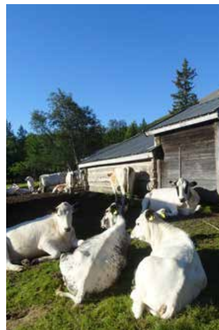
Nyvallen, Hede, Härjedalen.

VI VORE GLADA OM DU VILL VARA MED OCH SPRIDA VÅRT BUDSKAP, HÖR AV DIG TILL: