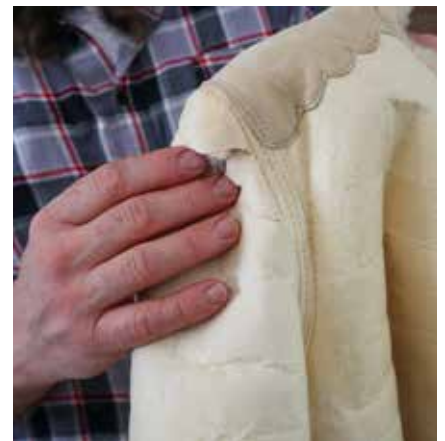
Skinn som skadats då det garvats med alun.