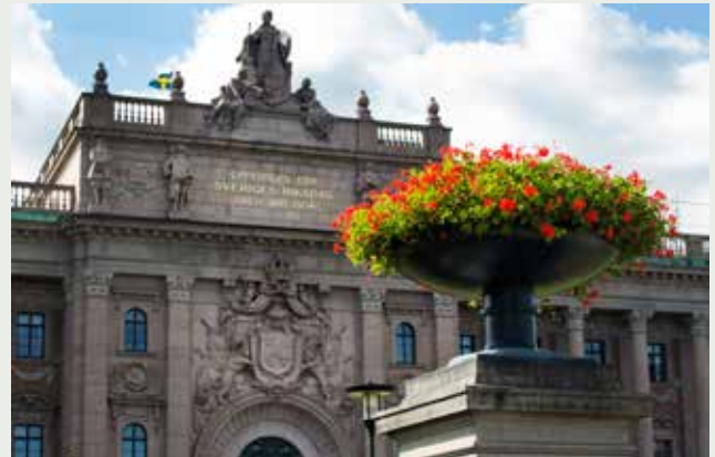
Riksdagshuset.

- Helt avgörande för att det immateriella kulturarvet ska leva vidare är att det finns utövare som för kunskapen och färdigheterna vidare till kommande generationer. Fäbodbrukets engagerade aktörer bidrar till att fäbodkulturens levande traditioner bevaras, hålls vitala och fortsätter utvecklas, säger kulturminister Parisa Liljestrand.