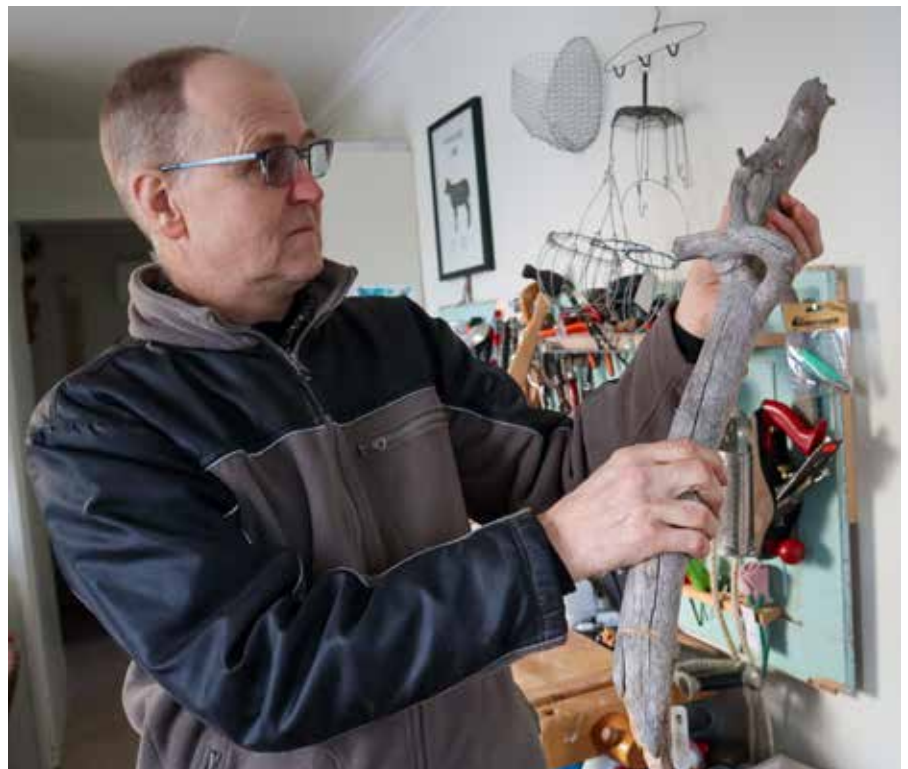
Vad kan det bli av den här då...?