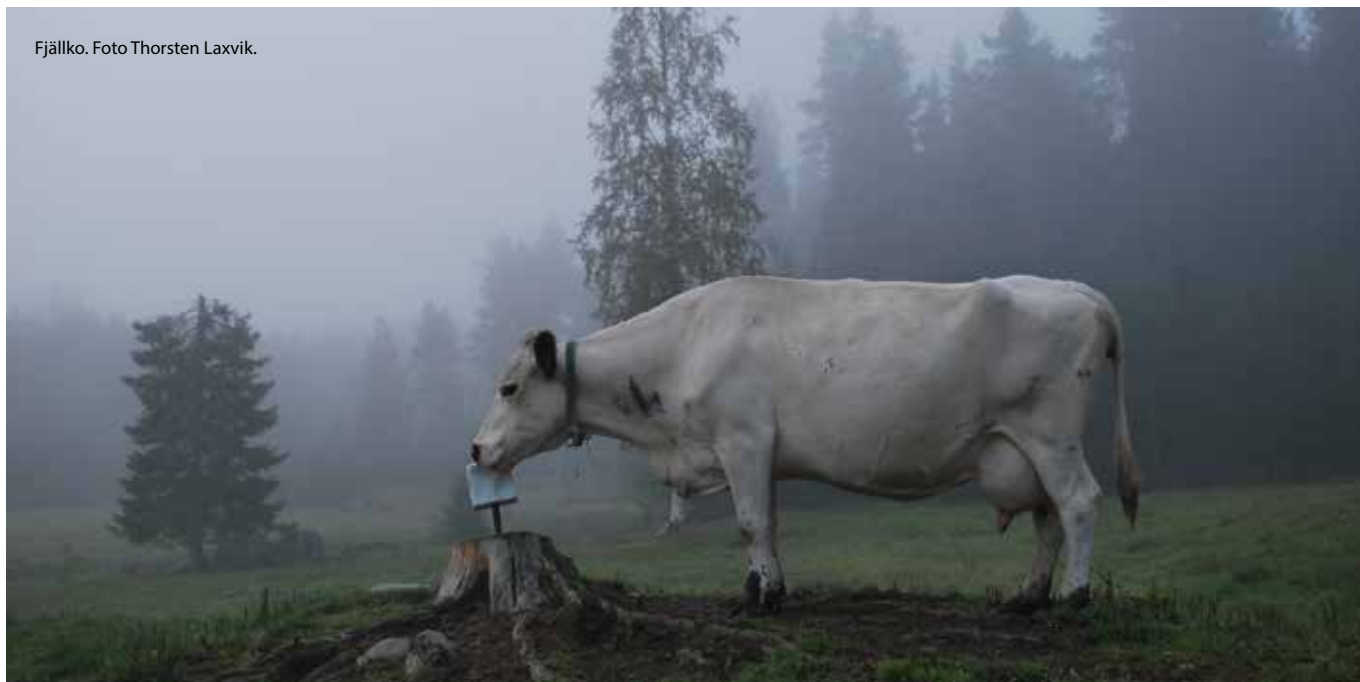
Fjällko.