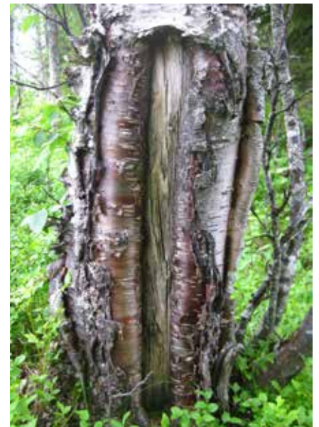
Ämnestäkt i björk.