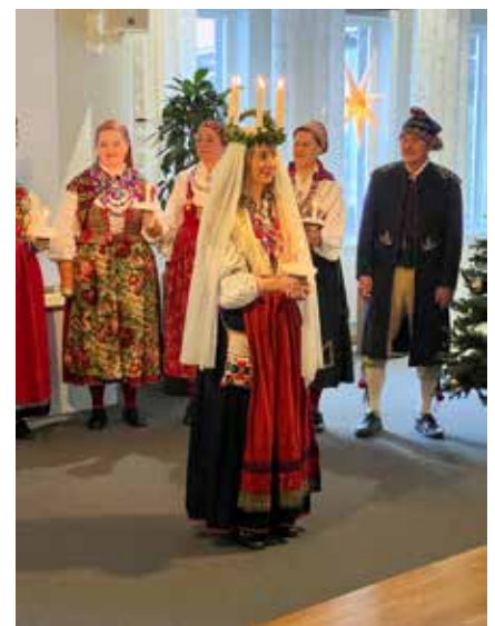
I kalla lucianätter för drygt 160 år sedan vandrade ett luciatåg från gård till gård i Malung. De sjöng jul- och lussvisor och deras klädedräkt var liksom ett vanligt brudfölje på den tiden. En Lussibrud, brudpigor, brudsvener och spelmän. Idag har Lussi från Malung fått sällskap av brudpigor, brudsvener och spelmän från Dala-Floda, Mora, Rättvik och Leksand.