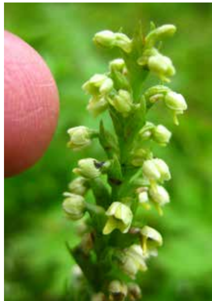
Vityxne, hävdgynnad ört i betesskogen.