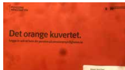
Pensionsbesked till Baqer Mosawi.