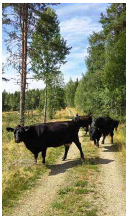
Angus på skogsbete.

Under 1800-talet skedde en ”hagifiering”, så att stora områden som tidigare varit ostängslade, delades in i hagar, som hörde till var sin gård. Djuren stängdes in i stället för ut. Det här genomfördes vartefter, söderifrån och norrut i landet, i olika omfattning. I mellersta Sverige utökades i stället fåbodruket, när trycket på markerna nära gårdarna ökade. I delar av norra Sverige hände det inte alls. I början av 1900-talet minskade behovet av