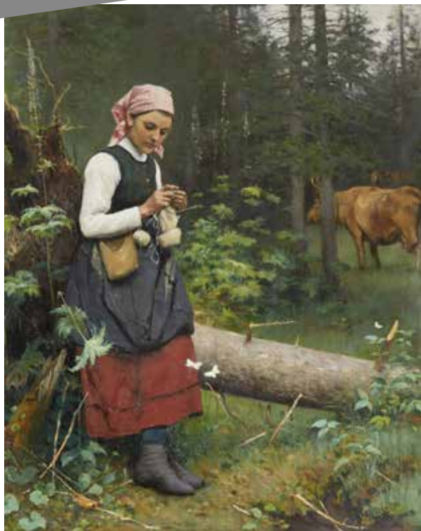
Vällflicka i skogsparti av Johan Tirén 1886.