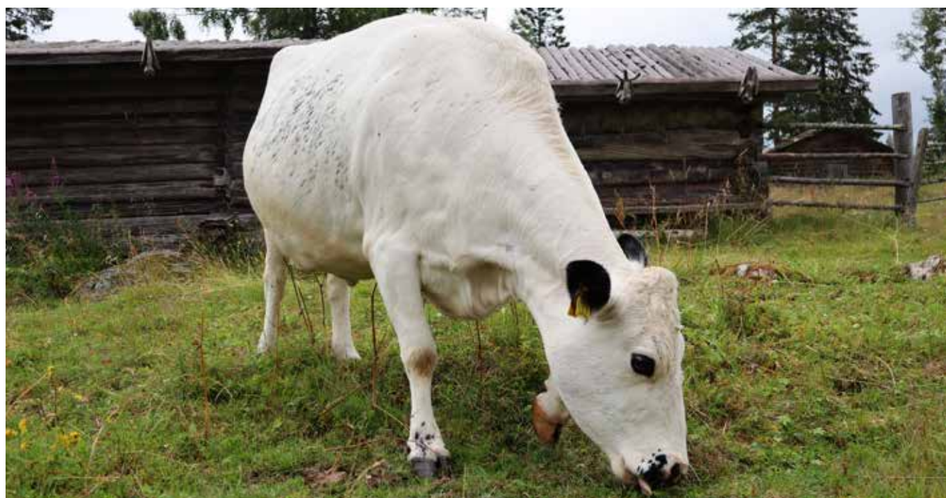
Ko på Ärteråsens fäbod, Foto Signe Bergström.

Tips! Följ Balder tidskrift och förlag på FB, eller gå in på www.baldersforlag.se