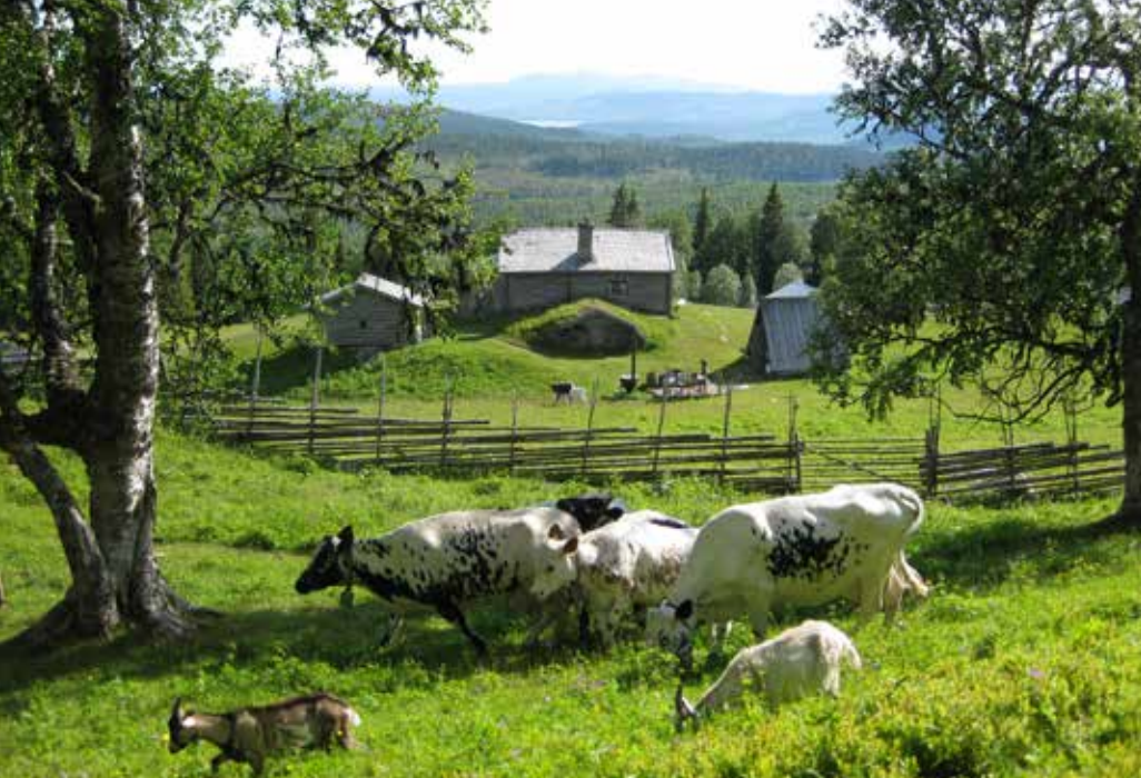
Myrbodarna, Valsjöbyn.