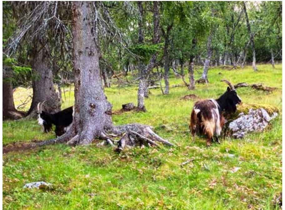
Rockvallen, Bruksvallarna.

"Den gamla betesskogen, både kring fåbodarna och i betade skogar i övrigt har i dag inget bra fungerade skydd"