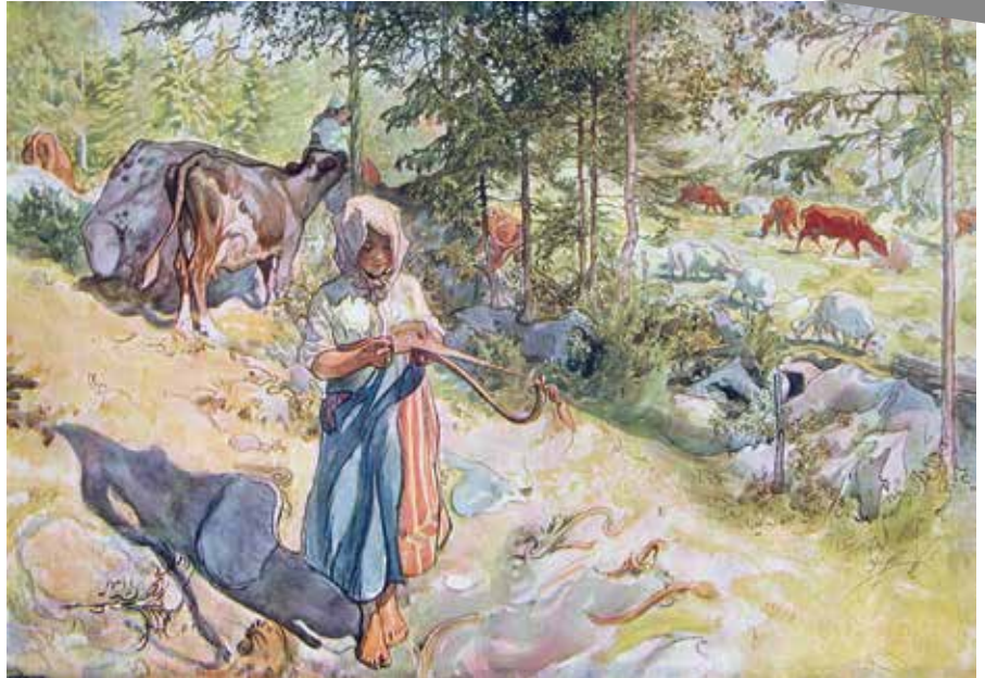
Bandgrind, Valkulla ur Spadarvet, Carl Larsson 1906.

Andra textila sysslor vid fäboden kunde vara att brodera. En uppteckning från Leksand berättar om en kvinna som var ute i skogen och vallade djuren. Under middagsvilan satt hon så inne i sin stuga och broderade på ett krushalskläde. Plötsligt såg hon att en