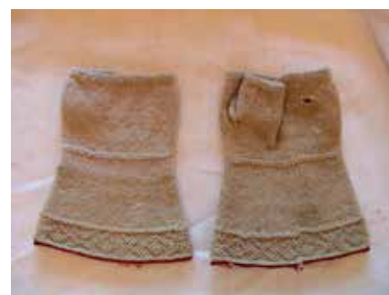
Tvändsstickade vantar.

I stort sett varje gård höll sig också med får, som skulle klippas fyra gånger om året. Man hade en typ av får och man sorterade ullen efter vad den skulle användas till. Man sparade på ull tills man hade tillräckligt för att få ihop till att spinna till det som ullen var ämnat till. Behovet av vantar och sockor var stort och för att kunna sticka ett par sockor krävdes får som skulle klippas vid rätt