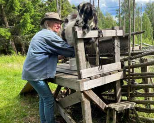
Vad fan är det här, glöm det!